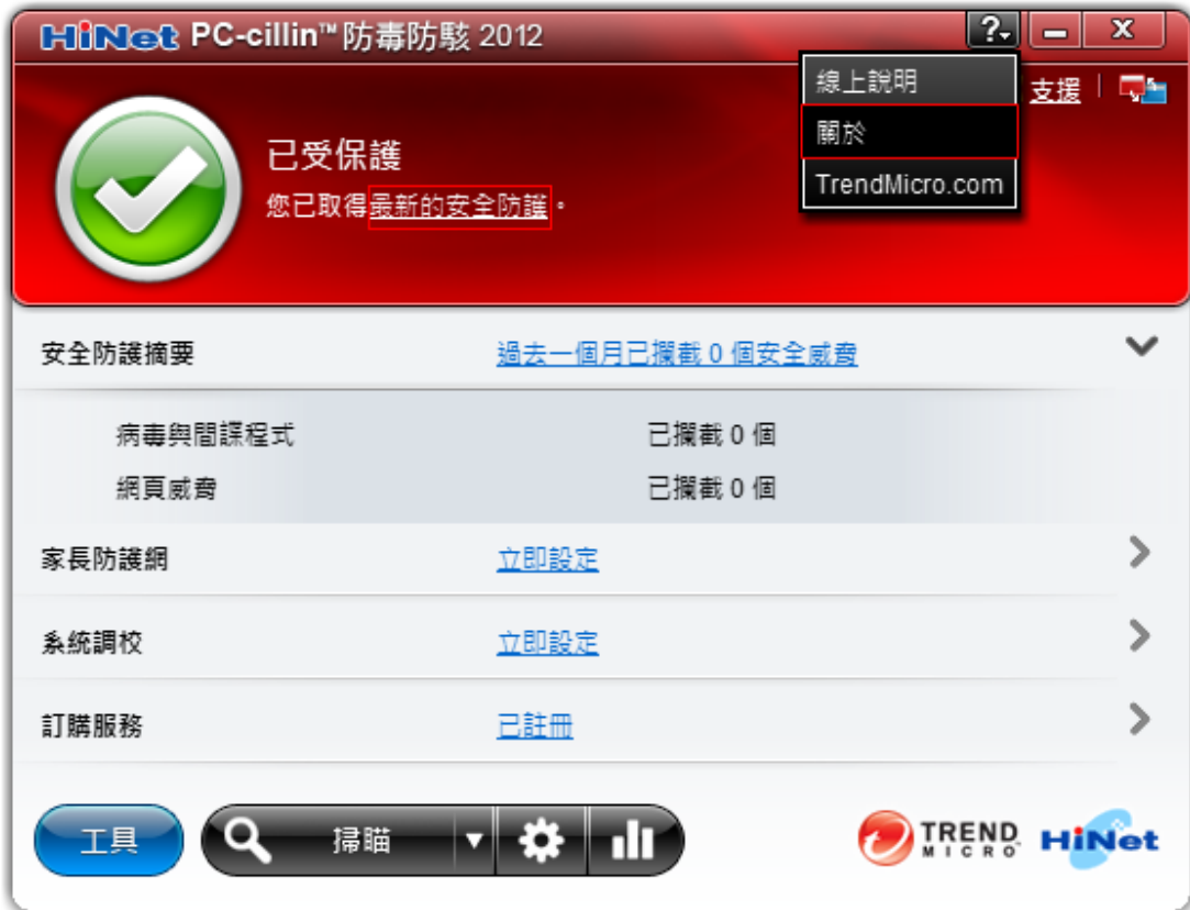
圖 17. 「主畫面」手動更新視窗