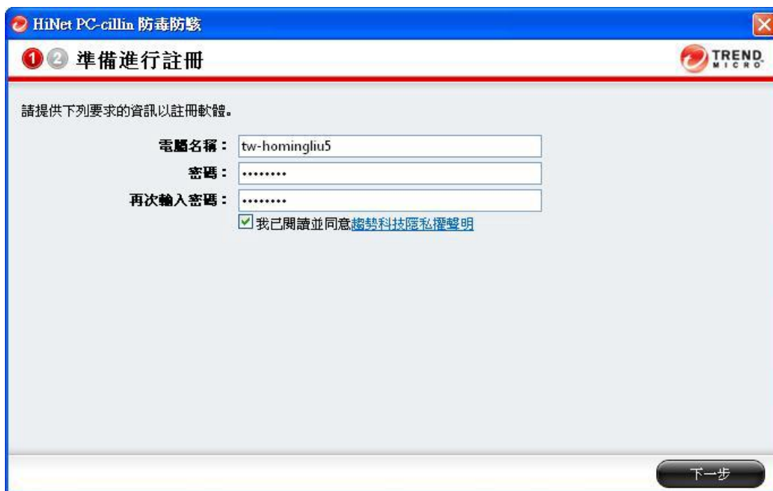
圖 15. 「準備進行註冊」視窗