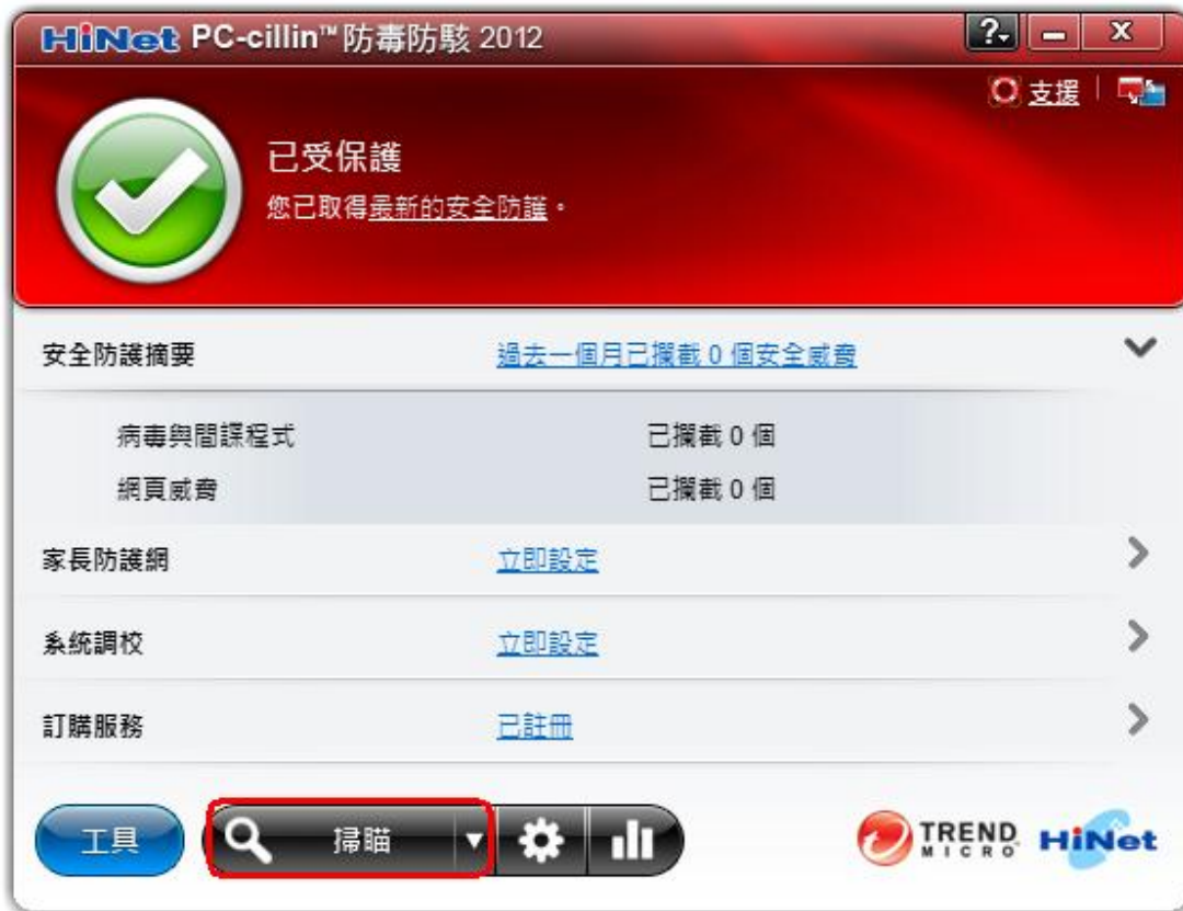
圖 19. 「立即掃描」視窗

請按一下主畫面上的「掃描」按鈕啓動快速掃描，以檢查您的電腦中是否感染病毒或安全威脅。