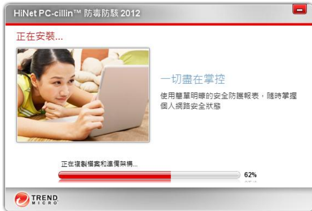
圖 13. 「安裝過程」視窗