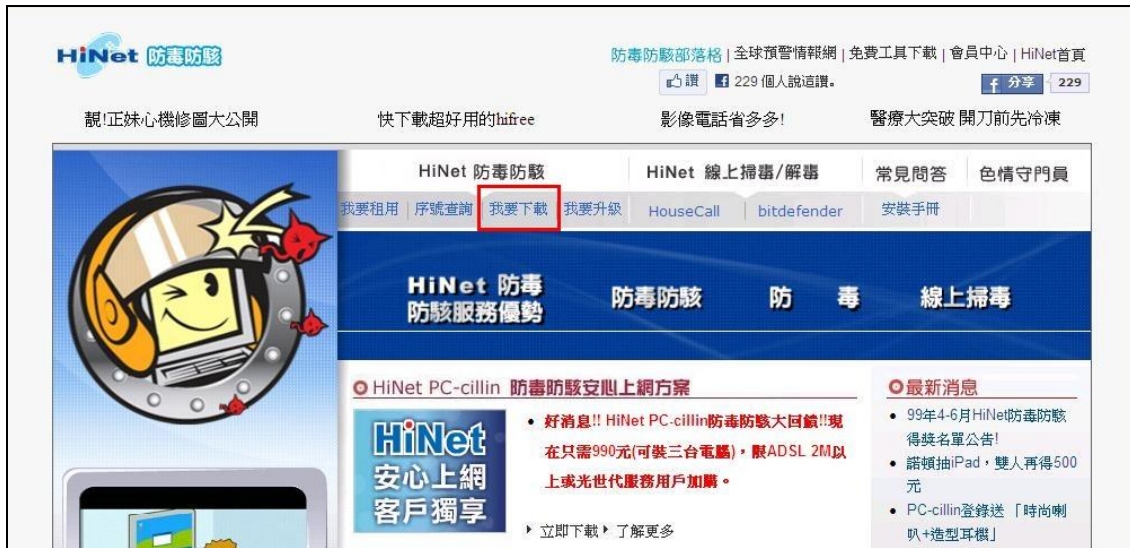
圖 1. 「HiNet 防毒防駭」畫面