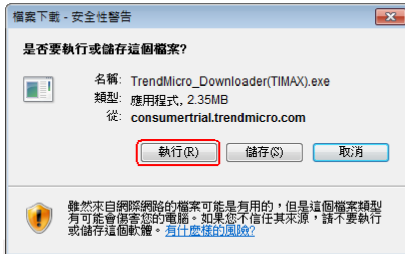
圖 7. 「檔案下載」視窗