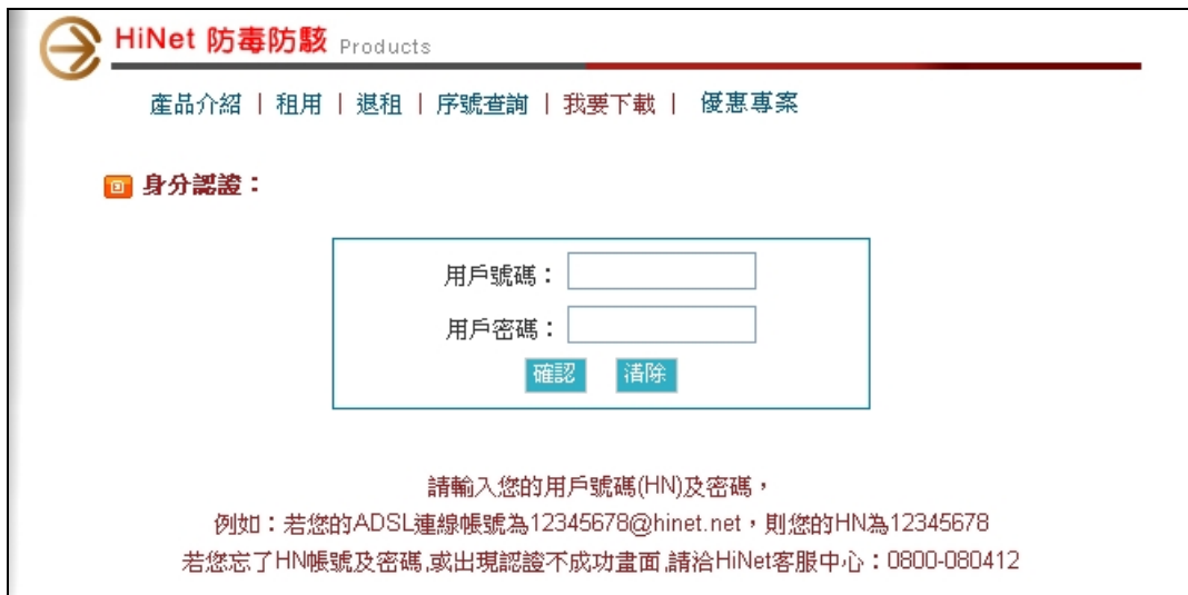
圖 2. 「身份認證」畫面