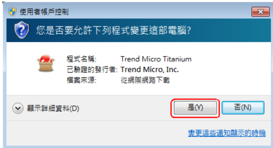
圖 8. 「檔案執行」視窗

7. 趨勢科技安裝精靈會執行趨勢科技下載程式(Trend Micro Downder)，開始協助您自動下載產品安裝程式和序號且順利進行安裝。