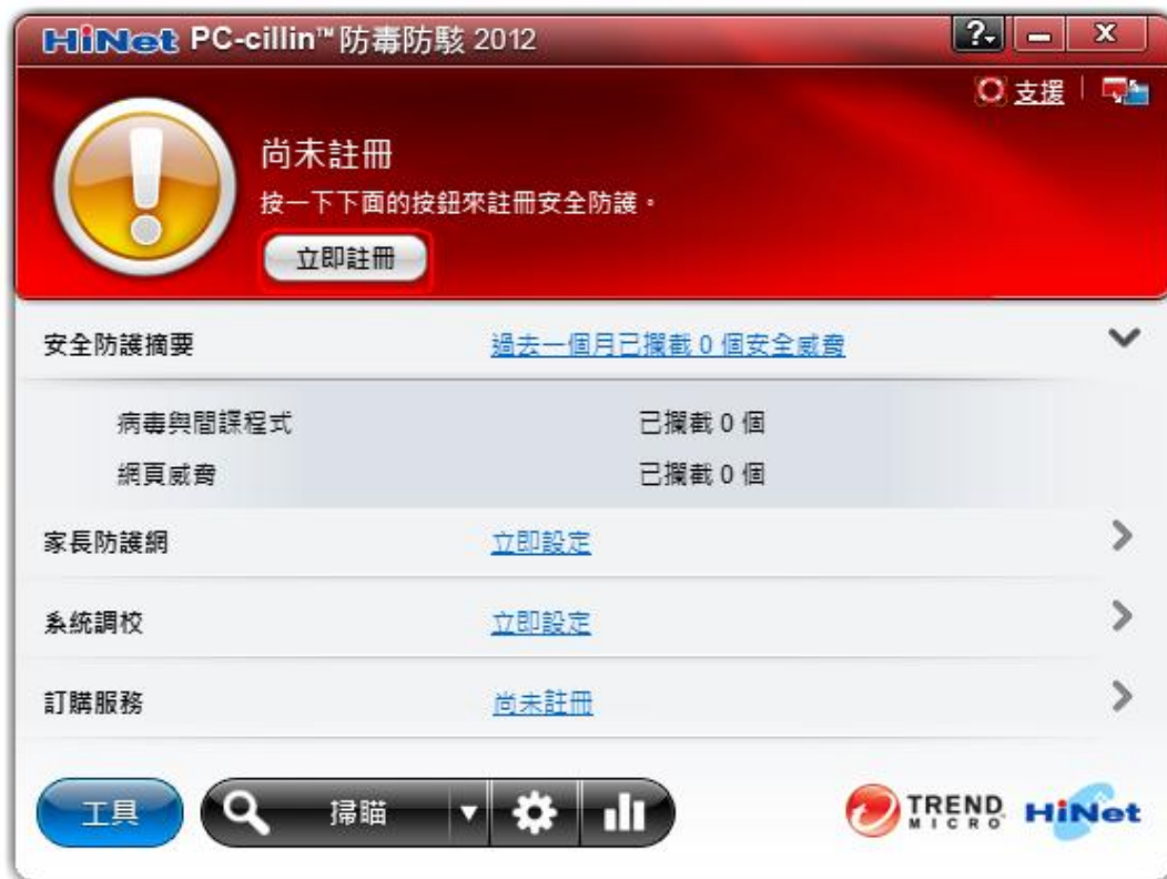
圖 14. 「立即註冊」視窗

請您在「準備進行註冊」視窗中提供電腦名稱和密碼以註冊本軟體，然後再按一下「下一步」以完成產品註冊過程。