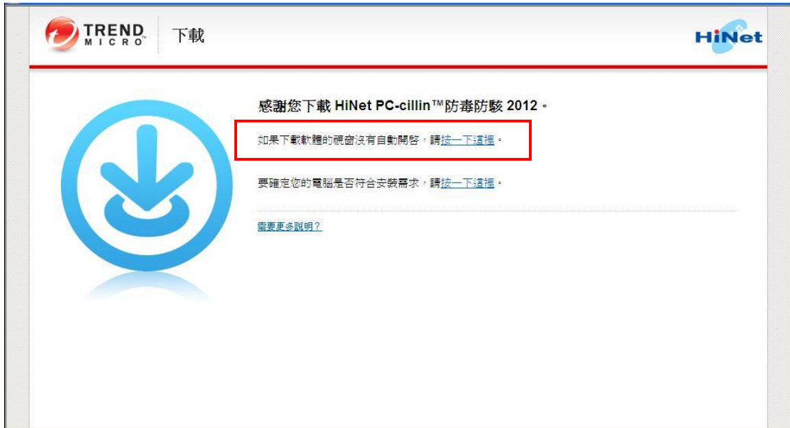
圖 10. 「手動下載」畫面

8. 下載完成后會自動開始軟體安裝步驟。趨勢科技安裝精靈會將序列號自動載入「提供您的產品序號」畫面，然後按一下「下一步」。