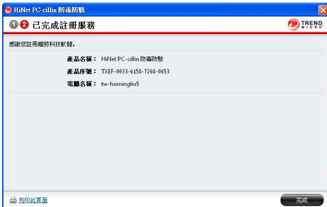
圖 16. 「已完成註冊服務」視窗