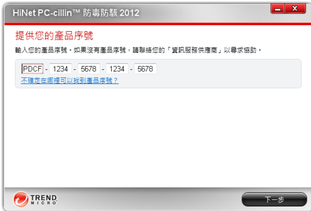
圖 11. 「提供您的產品序號」視窗

8. 下載完成后會自動開始軟體安裝步驟。趨勢科技安裝精靈會將序列號自動載入「提供您的產品序號」畫面，然後按一下「下一步」。