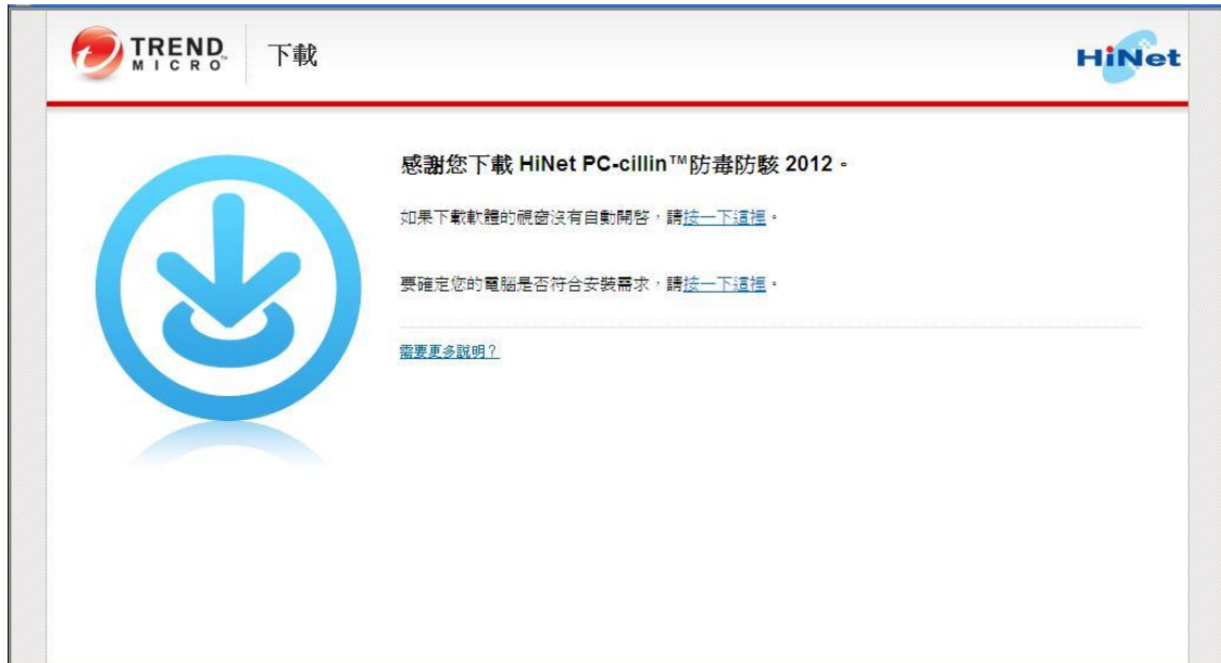
圖 6. 「快速安裝精靈下載」畫面