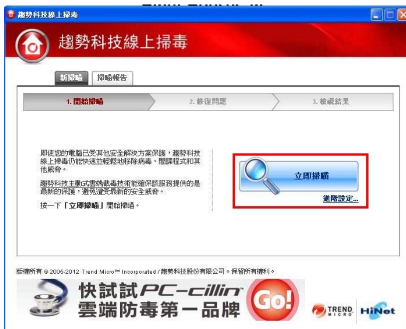
(圖一-8：線上掃毒設定畫面)