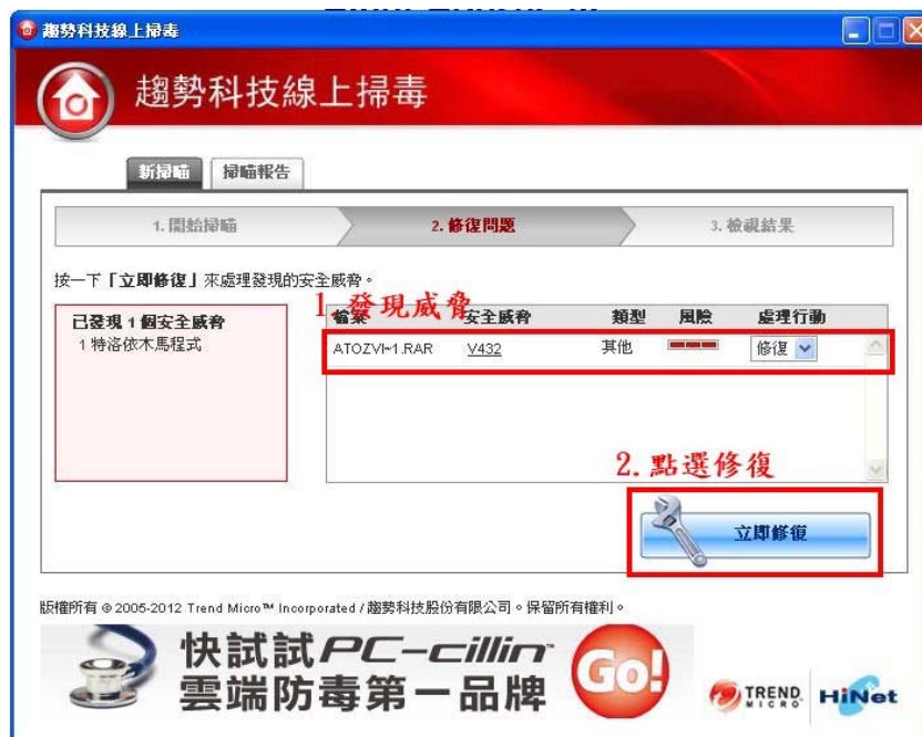
(圖二-13：線上掃毒掃描完成畫面)