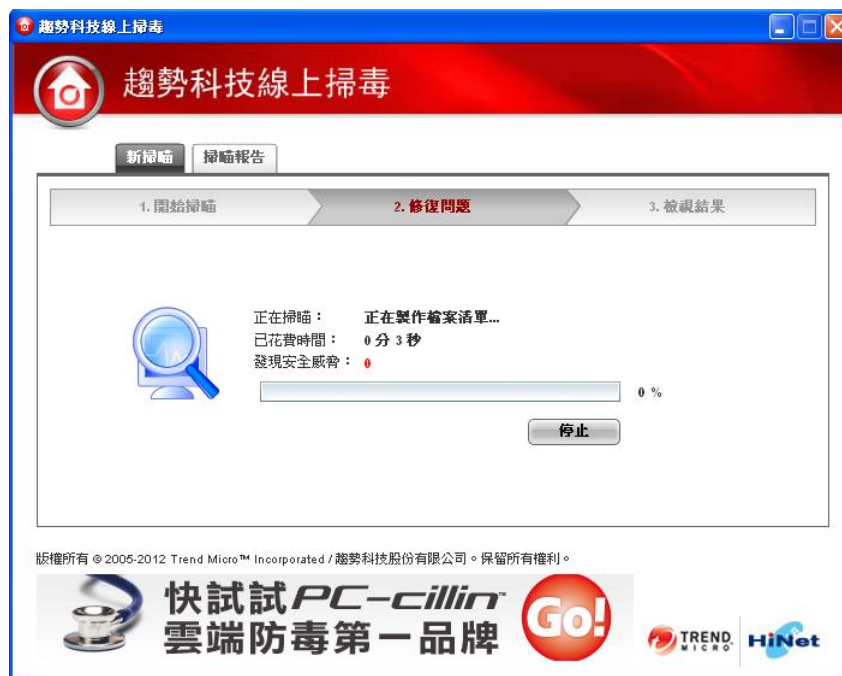
(圖一-9：線上掃毒執行畫面)

為防止資訊誤用，本文件自下載日(2012-08-17)起當日有效。最新版本文件請至企業資安服務網站下載。