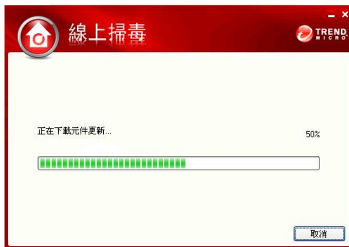
(圖一-6：檔案執行畫面)