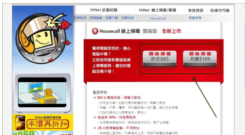
(圖一-2：HouseCall 線上病毒掃描)