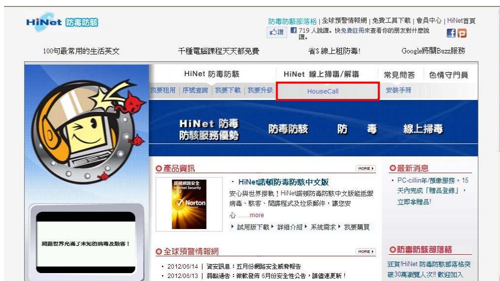
(圖二-3：HiNet 防毒防駭網站)