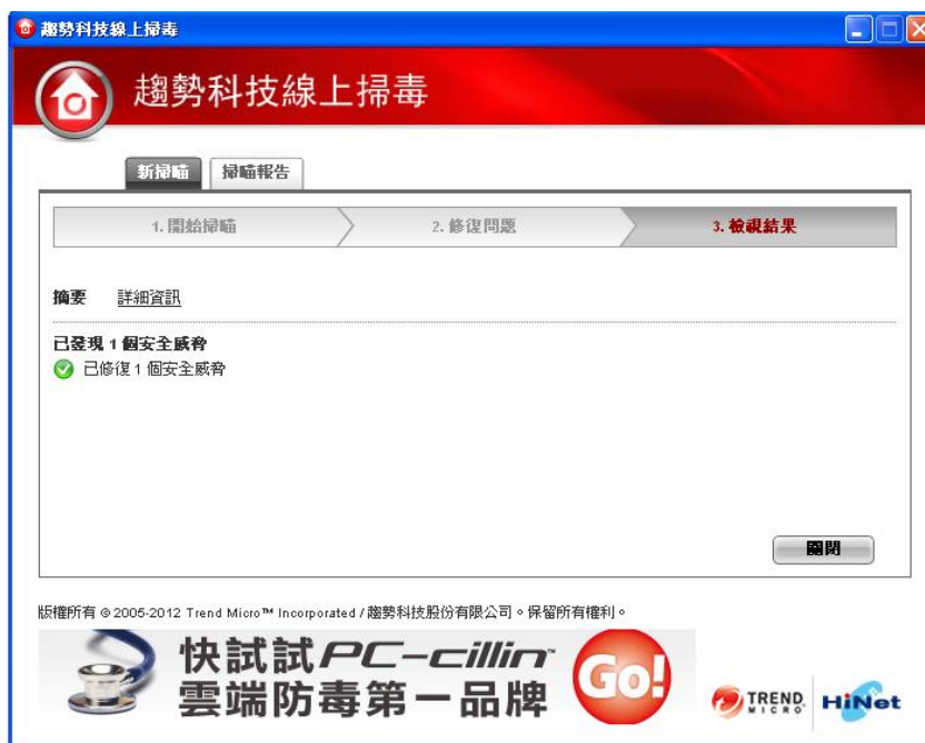
(圖二-15：線上掃毒修復完成畫面)