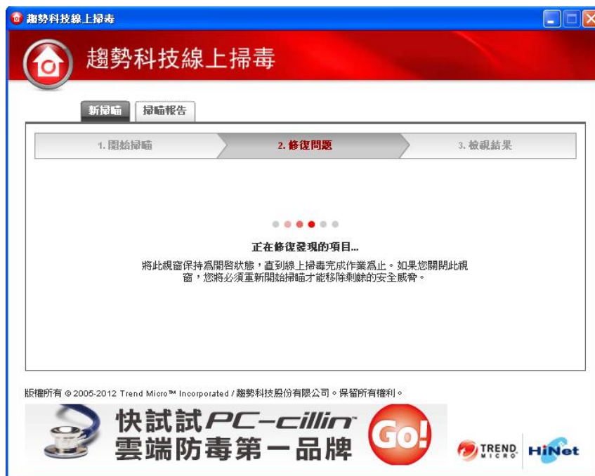
(圖一-11：線上掃毒修復畫面)

為防止資訊誤用，本文件自下載日(2012-08-17)起當日有效。最新版本文件請至企業資安服務網站下載。